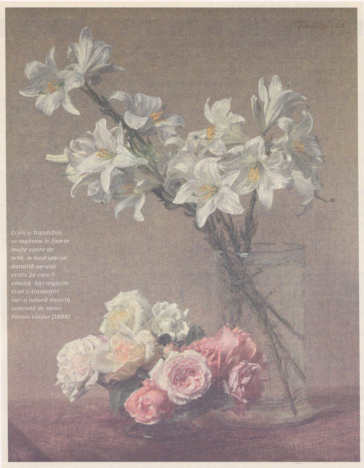
Crinii și trandafirii se regăsesc în foarte multe opere de artă, în mod special datorită aerului erotic pe care îl emană. Aici regăsim crinii și trandafirii într-o natură moartă semnată de Henri Fantin-Latour (1888).